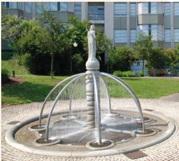
TEXT ANDRÉ MADAUS

ger Bischof Walter Mixa stellte sich auf die Seite der Bewahrer. In dieser schwierigen Situation erinnerten sich die Schwestern von Dillingen der heiligen Crescentia von Kaufbeuren: »Alles Gute muss erkämpft werden«, hatte die Heilige im Jahr 1736 zu Schwester Aloisia Erlacherin gesagt, denn auch die damalige Meisterin des Konventes hatte beim Neubau der Klosterkirche große Widerstände zu überwinden. Besonders der Pfarrer der angrenzenden Kirche missgönnte den Schwestern ihr modernes Gotteshaus. »Diese Worte waren für uns selbst eine große Ermutigung«, sagt Schwester Nicole, die schließlich nach eineinhalb Jahren die Genehmigung für den Umbau erhielt. In das gläserne Kreuz, das wie ein Lichtstrahl den roten Marmor des neuen Altars durchbricht, hat die Künstlerin eine Reliquie der heiligen Crescentia eingelassen. Auf diese Weise hat sie eine Brücke gebaut zwischen Vergangenheit, Gegenwart und Zukunft. ■