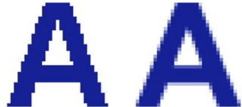
Vergrößerte Darstellung: links ohne, rechts mit Kantenglättung

Das Thema Antialiasing (auch Treppenglättung oder Kantenglättung genannt) wird den meisten Menschen begegnet, wenn sie Computergrafiken erstellen, der Begriff wird aber auch in der Elektroakustik verwendet, das grundsätzliche Prinzip ist dabei identisch.