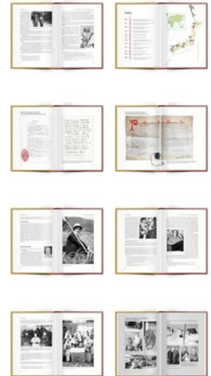
Beispielseiten des Buches